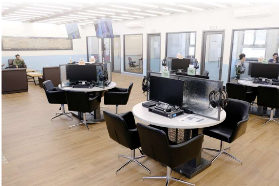
▲圖1-13 前棟2樓視聽室提供不同類型視聽影片，讀者可選擇單人或雙人席位觀賞電影

踏上辦公室外的步梯可直達前棟2樓，首先映入眼簾的是牛皮沙發區，舒適的沙發成為讀者休憩的最佳去處。沙發區旁為筆電優先區，對面則為系統資訊組辦公室。為提供校內師生一處學習討論的場域，沙發區右側為討論小間暨視聽室，該區配置有單人及雙人視聽席位，並設有6間討論小間及1間團體視聽室，豐富師生的學習環境（圖1-13及圖1-14）。