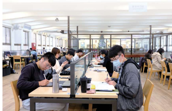
▲圖1-17 前棟3樓閱覽區經過整修後，成為學生最愛的自修場域