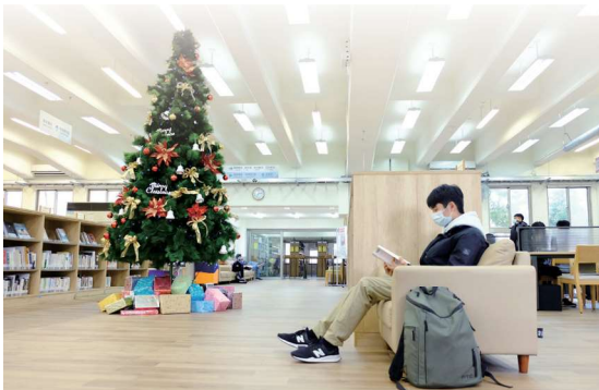
▲圖1-16 心煩的時候，不妨帶上一本書，坐在舒適的沙發裡開啟閱讀的世界（攝於前棟3樓暢銷書 / 經典書 / 現期期刊 / 閱覽區）

再沿著階梯來到前棟3樓暢銷書及經典圖書區，該區於108年5月完工啟用，除提供184席閱覽席次外，亦配置有沙發共30席，讓讀者在瀏覽架上暢銷書或經典書後，即可坐上沙發裡，享受屬於一個人的閱讀時光。因本區形塑享讀氛圍，加上環境舒適，每逢下午經常座無虛席，是讀者最愛留連的地方（圖1-16及圖1-17）。