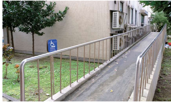
▲圖1-22 囿於老建築空間利用不易，無障礙坡道設於館舍後門，採服務鈴方式提供服務。進入後即為本館後棟1樓C庫

圖書館大門因老建物設計未規劃有無障礙環境配置，加上空間利用不易，因此目前無障礙坡道設於館舍後方，採按服務鈴方式，由本館人員立即提供協助（圖1-22）。110年本館將進行圖書館大門環境優化案，大門右側將新設無障礙坡道，預計110年12月啟用，屆時將可大幅改善行動不便者利用圖書館的環境。