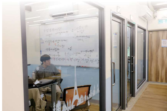
▲圖1-14 前棟2樓討論小間設有布幕及白板等設備，方便同學討論課業用

在討論小間暨視聽區對面，亦即沙發區的左側，則為提供了120席自修席次的閱覽室，由於隔板設計增加獨立性，是一處讓莘莘學子安靜讀書自修的好地方（圖1-15）。惟閱覽室的桌椅已使用逾40年，無法營造舒適閱讀氛圍，加上1樓及2樓廁所老舊，109年獲校方補助經費，將進行2樓閱覽室及1-2樓廁所翻新工程，110年進行施工階段，預計110年10月啟用。