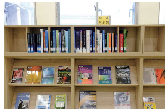
▲ 圖1-10 前棟1樓廊道設有新書展示區，讓經過的讀者可瀏覽架上的新書

走回1樓穿廊，左側為新書展示區（圖1-10），設置了單人座沙發，吸引讀者駐足閱讀。另設有自助借書機及圖書除菌機，讓讀者安心借閱圖書（圖1-11）。