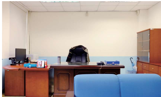
▲圖1-12 位於前棟1樓右側的採編組辦公室（左圖）及館長室（右圖）