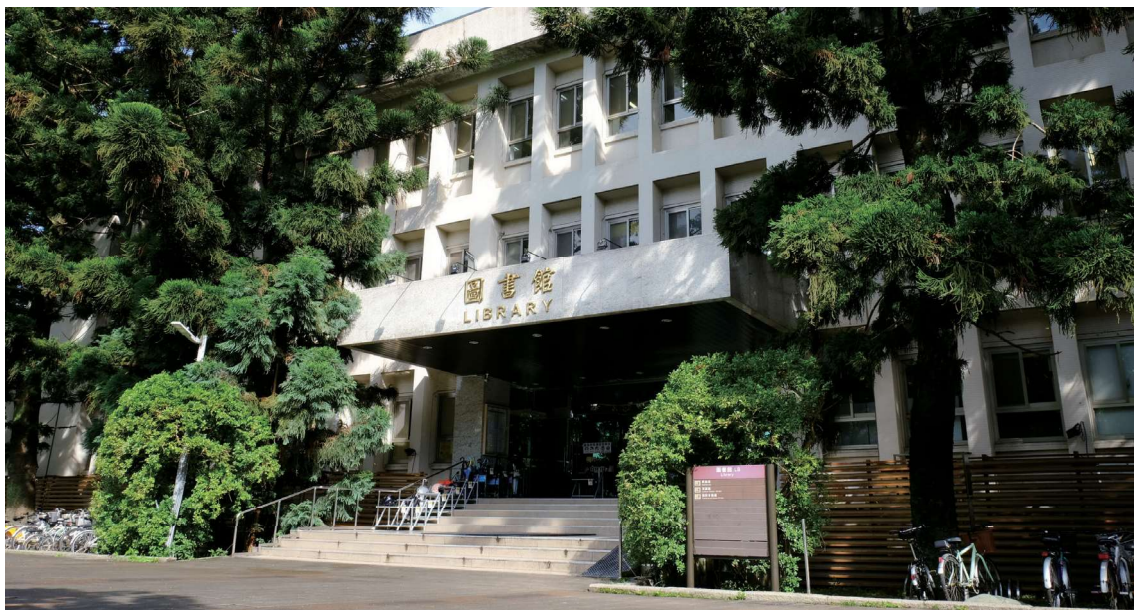
▲圖1-5 圖書館大門外綠意盎然，充滿著生機

踏入台科大位於基隆路校門後，左前方即可望見圖書館大樓。大門兩側矗立著9棵綠意盎然、年逾45年之龍柏，顯得朝氣蓬勃。（圖1-5）