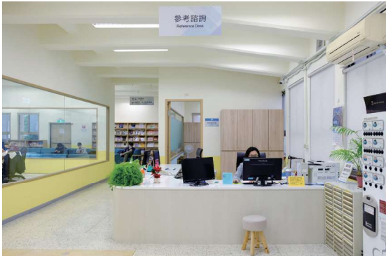
▲ 圖1-8 從圖書館左側門禁進入前棟1樓後，左轉即可看到參考諮詢區

從流通櫃台左側門禁刷卡入館後，即可看到落地型數位電子看板，左轉後即為參考諮詢區，參考櫃台前方設有一台全自動咖啡販賣機，只須投幣20元即可享用香濃咖啡（圖1-8）。參考櫃台左側為資訊共享區（電腦教室），設置有34席電腦席次，該區結合多元功能，平常開放讀者使用，遇館內辦理資料庫講習時則作為電腦教室使用；資訊共享區後方即為休閒雜誌區及閱報區（圖1-9）。