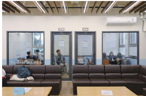
▲圖1-23 前棟2樓的討論小間可供師生借用討論交流，使用率非常高