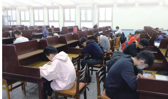
▲圖1-15 前棟2樓閱覽室桌椅因隔板設計增加隱密性，深受讀者喜愛

在討論小間暨視聽區對面，亦即沙發區的左側，則為提供了120席自修席次的閱覽室，由於隔板設計增加獨立性，是一處讓莘莘學子安靜讀書自修的好地方（圖1-15）。惟閱覽室的桌椅已使用逾40年，無法營造舒適閱讀氛圍，加上1樓及2樓廁所老舊，109年獲校方補助經費，將進行2樓閱覽室及1-2樓廁所翻新工程，110年進行施工階段，預計110年10月啟用。