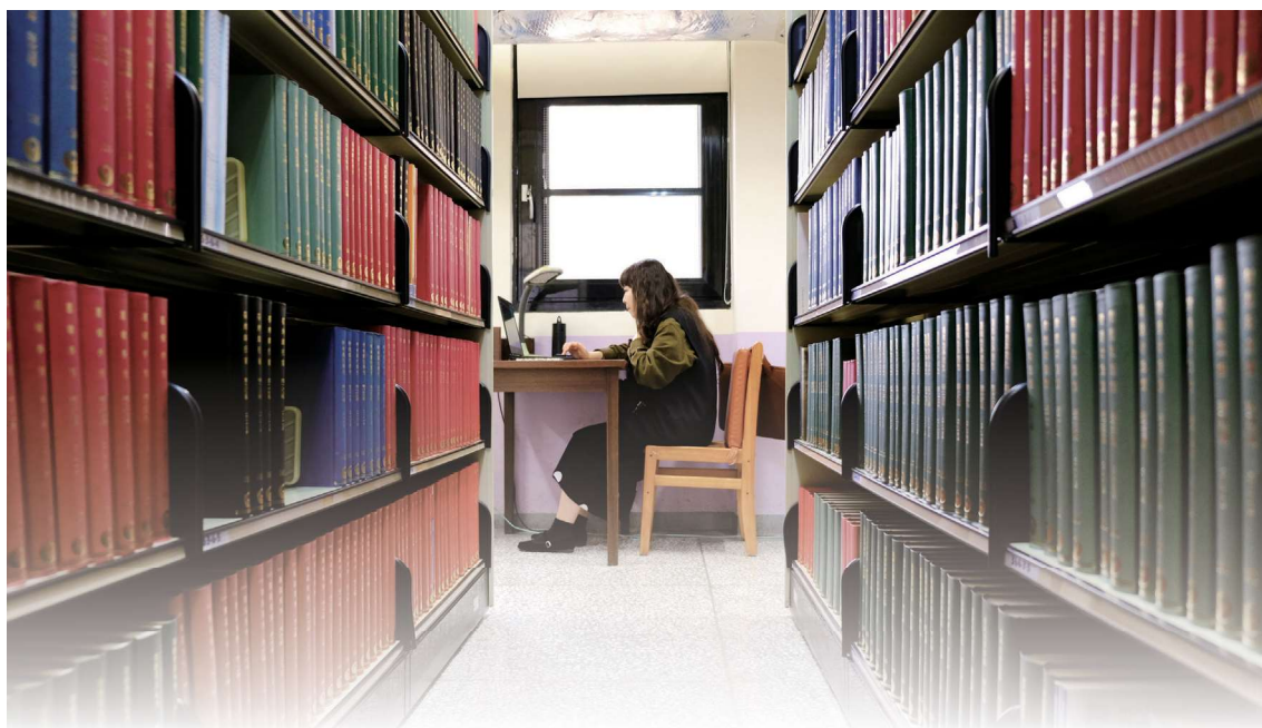
▲圖1-19 後棟5-8樓為中西文期刊合訂本區

當我們站在前棟3樓與後棟4樓連通道，後棟左側即為後棟A庫、正前方為B庫、右側為C庫。後棟A庫共有8層樓（靠基隆路），1-4樓為中文書庫區、5-8樓為中西文期刊合訂本區（圖1-19），每層樓書架兩旁皆配置了約10席閱覽席次，因位於安靜之處，適合喜歡寧靜閱讀的讀者使用。