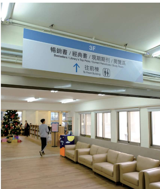
◀圖1-18 經過前棟3樓的連通道，即可到達後棟4樓書庫區（照片前方為前棟3樓，照片後方為後棟4樓（未顯示））。連通道兩旁放置單人座及雙人座沙發，供讀者休憩

由於圖書館為「工字型」建築，前棟共三層樓，每層樓挑高3米6，後棟共四層樓，每層樓2米4；因此，由前棟3樓經連通道後，即可到達後棟4樓（圖1-18）。