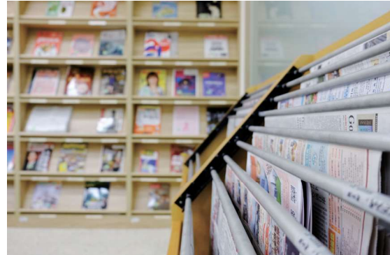
▲ 圖1-9 前棟1樓參考諮詢區後方提供報紙及休閒雜誌供讀者閱覽

走回1樓穿廊，左側為新書展示區（圖1-10），設置了單人座沙發，吸引讀者駐足閱讀。另設有自助借書機及圖書除菌機，讓讀者安心借閱圖書（圖1-11）。