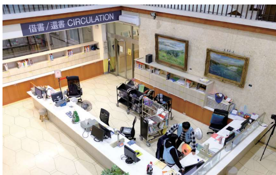
▲圖1-6 前棟1樓流通櫃台位於大門入口處。櫃台牆上右側掛有「南投清境農場」（左）及「美國尼加拉大瀑布」（右）油畫畫作，為國內油畫家林弘毅先生的作品

進入館內，流通櫃台即位於前棟1樓正中間，白色主調的櫃台於106年11月重新整修布局，除降低櫃台高度，增加親和力外，亦擴大了櫃台使用空間（圖1-6）。圖書館入口左側新增輕食區，設有32席，並配置有線電視，讀者可一邊飲食一邊觀看影片，該區經常一位難求，深獲讀者喜愛（圖1-7）。