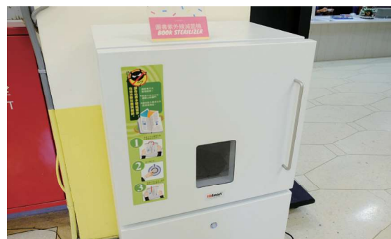
▲ 圖1-11 本館於前棟1樓流通櫃台一旁提供自助借書機（左圖）及除菌機（右圖），疫情期間讀者也能安心借閱圖書