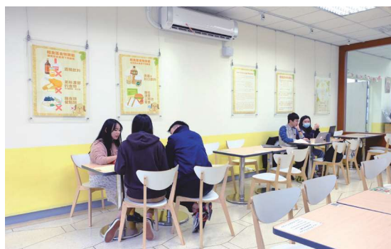
▲圖1-7 前棟1樓輕食區位於大門入口左側，方便讀者刷卡入館前在此飲食