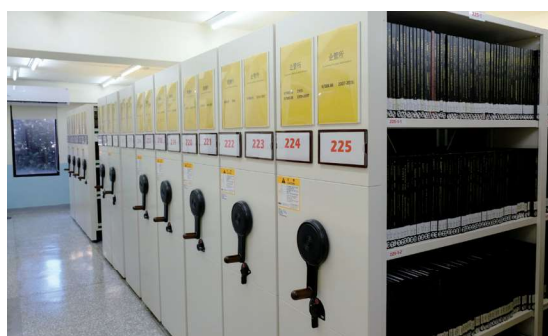
▲圖1-21 後棟2樓C庫為本校博碩士論文區