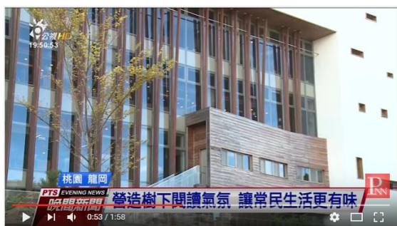
影片來源：公視晚間新聞